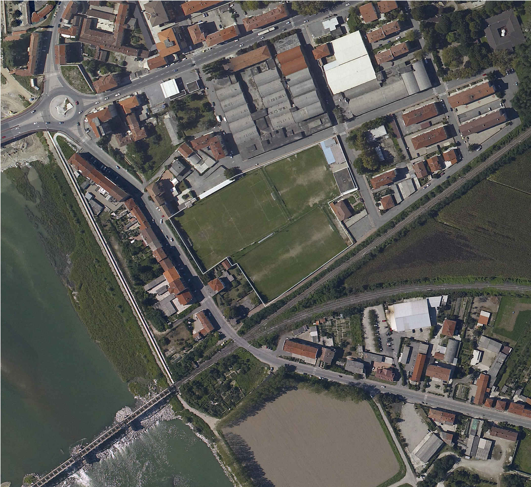
AEROFOTOGRAMMETRIA - scala 1/2000